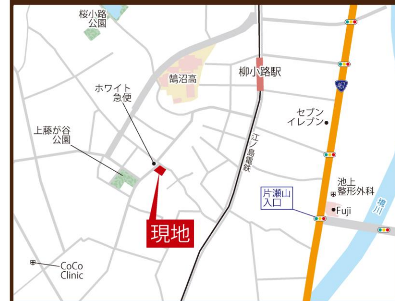
Access Guide Map 「藤沢市鵜沼藤が谷3丁目2-33付近」とご入力ください。

JR東海道本線・小田急江ノ島線「藤沢」駅徒歩 22 min. 江ノ島電鉄線「鵜沼」駅徒歩 7 min. 江ノ島電鉄線「柳小路」駅徒歩 5 min.