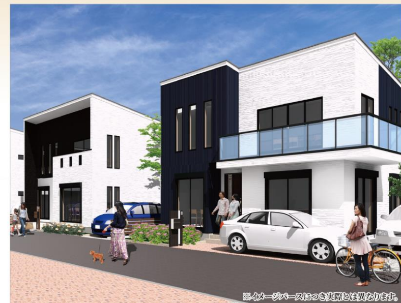
※イメージパースはあくまでイメージです。実際とは異なります。

駅徒歩5分の好立地に全2区画の分譲地が誕生いたしました。 敷地広々40坪! 湘南鵜沼エリアで3路線3駅徒歩圏の暮らしやすい永住地。 豊かな利便性とリゾートライクな生活が叶う住環境です。